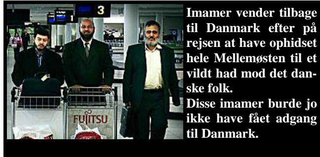
Imamer vender tilbage til Danmark efter på rejsen at have ophidset hele Mellemøsten til et vildt had mod det danske folk. Disse imamer burde jo ikke have fået adgang til Danmark.