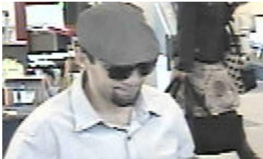
Flere muhamedanske indvandrere har allerede forsøgt at udløse bombeterror i København, og et vellykket attentat vil formodentligt udløse et meget blodigt opgør mellem muhamedanere og danskere.

Ja, sprængfarlig er islam, og tusinder af bomber og selvmordsbomber dokumenterer det, og skønt man påstår, at islam ikke er farlig, så sprænges der hver dag bomber i islams og profetens navn. Det erkender man nødtvunget, men man forsøger også at bilde danskerne ind, at de muhamedanske indvandrere er helt anderledes end deres trosfæller i Afghanistan eller Irak, men hvorfor skulle de egentlig være det? Mange af dem kom-