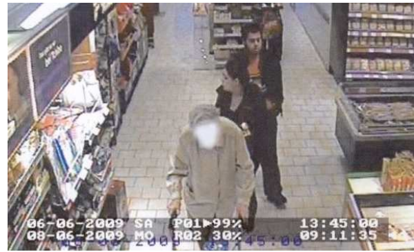
Den 97-årige handikappede kvinde umiddelbart før hun angribes bagfra af de to indvandrere.