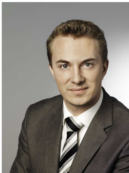
Morten Messerschmidt (DF)

Morten Messerschmidt fra Dansk Folkeparti blev EU-valgets danske sejrherre, og dermed manifesterede den danske EU-modstand sig kraftigt. I Danmark er der helt åbenlyst ingen folkelig baggrund for ideen om et forenet Europa.