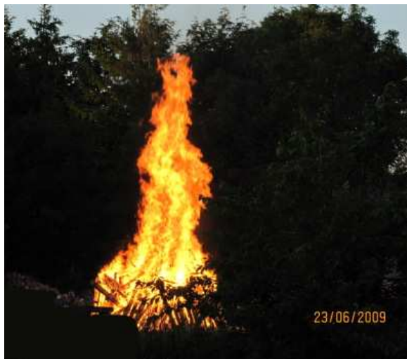
Det første danske Sct. Hansbål med koranen som brændsel, men sikkert ikke det sidste.

I anledning af denne begivenhed ved Sct. Hans er spørgsmålet nu blevet stillet: »Er det patriotisk korrekt at afbrænde koraner, når man ønsker at udtrykke foragt for islam, skønt man i øvrigt går ind for fuld ytringsfrihed?« Dette spørgsmål er både principielt og interessant, og svaret på spørgsmålet må være, ja, det er en patriotisk handling at afbrænde koraner, og det er ikke i modstrid med princippet om fuld ytringsfrihed! Hvorfor nu det? For det første gives der ingen bedre måde at vise foragt for det umenneskelige islam end ved at afbrænde Koranen, der jo formulerer de menneskefjendske leveregler, og for det andet, så er en afbrænding af en bog ikke i strid med ytringsfriheden, for så vidt denne bog da tilhører den, som brænder den af. Det er kun, hvis man afbrænder andres bøger før eller efter udgivelsen, at der kan være tale om en krænkelse af ytringsfriheden, idet man så forhindrer andre i at udbrede tanker og meninger. Det er altså helt legalt at udtrykke sin egen mening ved privat eller offentligt at afbrænde en bog, som man selv ejer, det står fast, trods en københavnsk politichefs forsøg på at forvirre borgerne. Under Muhammedkrisen rystede det danske politi af skræk ved udsigten til et stort opgør mellem