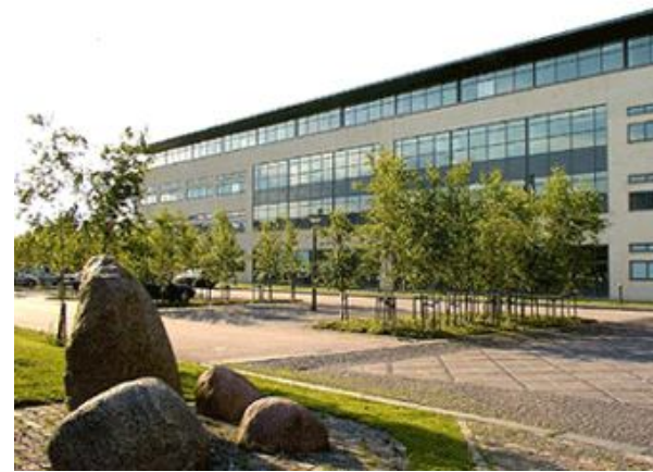
Politiets Efterretningstjeneste på Klausdalsbrovej udsender nogle temmelig modstridende tilkendegivelser angående terrortruslen.

det end det nuværende samfundssystem. Det var mere relevant at kalde sådanne systemtro personer for ekstremister. I øvrigt er træning i kampsport og våbenbrug da meget nyttig og legitim, uanset hvad PET siger, for i vore dage kan man hver dag risikere at blive angrebet af fremmede forbrydere, som hele landet er overfyldt med. Når politikerne lukker de vældige skarer af fremmede ind i landet, så ville det være godt om alle danskere blev trænet i kampsport og våbenbrug, for det kan der virkelig blive brug for i fremtiden.