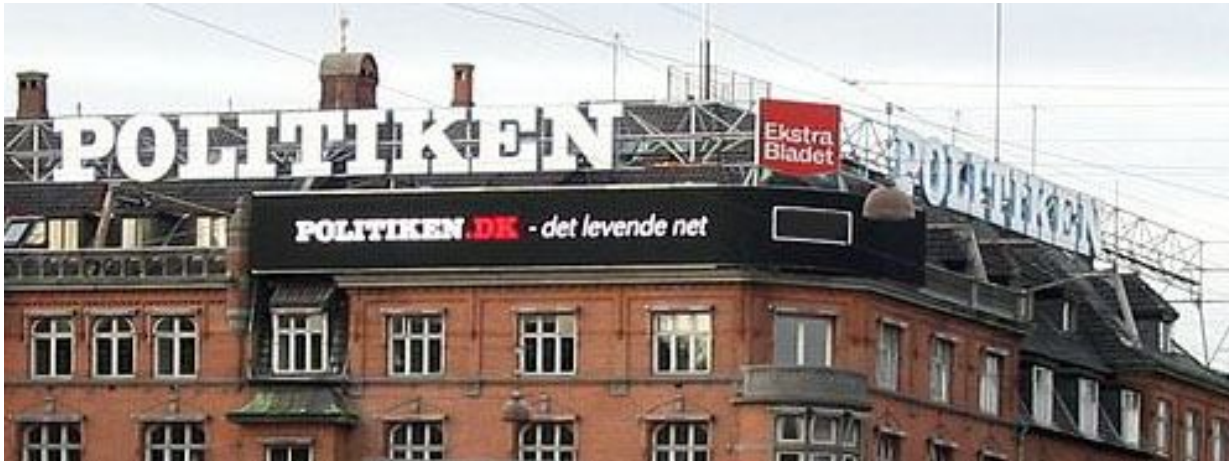
Politikens hus - den kommende stikkercentral