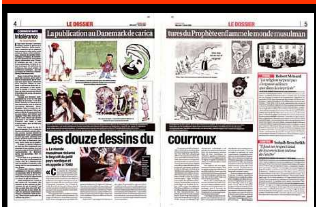
Også i Frankrig føres kampen mod islams terror og censur, og Muhammedtegningerne har en stor symbolsk betydning for denne kamp.