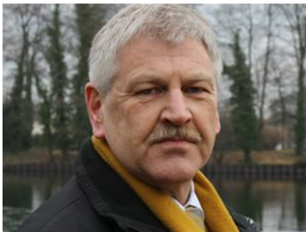
Partilederen for Nationaldemokratische Partei Deutschlands (NPD), Udo Voigt.