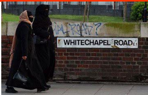
I det "nye" London bevæger mellemøstlige spøgelses sig gennem gaderne som i en horrorfilm.